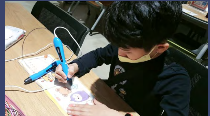
Activity using a 3D pen on the topic of Climate Change